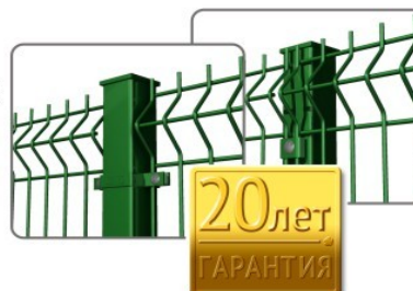
пруток 4,0 мм

Популярный и востребованный забор для ограждения коттеджей, дачных участков, складских территорий, школ, детских садов, автозаправочных станций, паркингов, внутренних строений промышленных объектов.